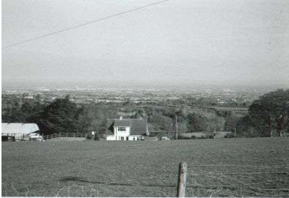
Näkymiä Large Hillistä, kukkulan alla siintää Dublin.

Leirialueen yhteydessä oli muun muassa Irlannin partiolaisten päämaja eli paikallinen Partiotalo. Rakennus oli arkkitehtuurisesti hyvin mielenkiintoinen, kuin jättimäinen kota.