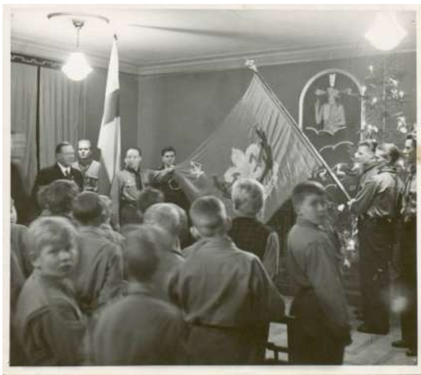
Lippukunnan lipun vihkiäiset

Valokuva kertoo enemmän kuin tuhat sanaa, siksi valokuvat pitää säilyttää huolella. ARKISTOKAAPISTA EI SAA ENÄÄ IKINÄ LÖYTYÄ RYPPYISESSÄ KIRJEKUORESSA KAIKKIEN TAVAROIDEN SEASSA LOJUVA VALOKUVIA! Valokuvista koostetaan kansio, jossa on happovapaasta kartongista tehdyt lehdet ja hyvät välilehdet tai mahdollisesti PP-muoviset taskut. Parhaimmat valokuvat voidaan kehystää ja laittaa näytille. Kehystämisessä pitää muistaa, että kuva ei saa koskea lasia! Kuva pitää siis kiinnittää taustalevyyn kiinni. Valokuvien säilytyspaikkana toimii kamerakerhon vanha valopöydän laatikosto. Samaan tilaan ei saa laittaa valokuvakemikaaleja!