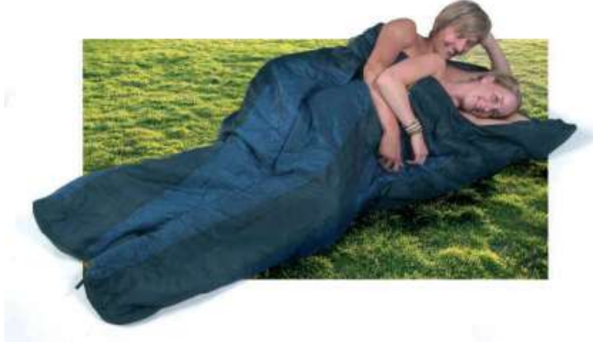
Makuupusseja voi myös yhdistää

ei myös mahdu laittamaan vaatteita päälle. Nykyään pusseista tehdään useita eri kokoja, joten kannattaa olla tarkkana kaupassa että ostaa oikean kokoisen. Talvipussi on riittävän iso, kun siellä mahtuu pukemaan ja riisumaan välihouset ja sukat. Kasvavalle partiolaiselle ei kuitenkaan tarvitse ostella uusia pusseja koko ajan, sillä toimiva ratkaisu on kiristää pussin jalkopäästä ylipitkä osa umpeen irtoremmillä tai vastaavalla.